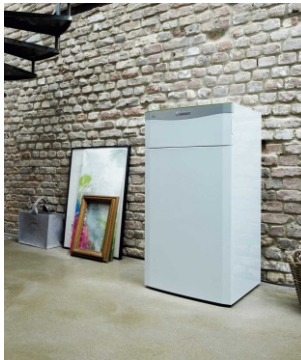
M-06 Sole/Wasser-, Wasser/Wasser-WP

Weitere Informationen zum Förderprogramm finden Sie unter www.liechti-ag.ch/heizung