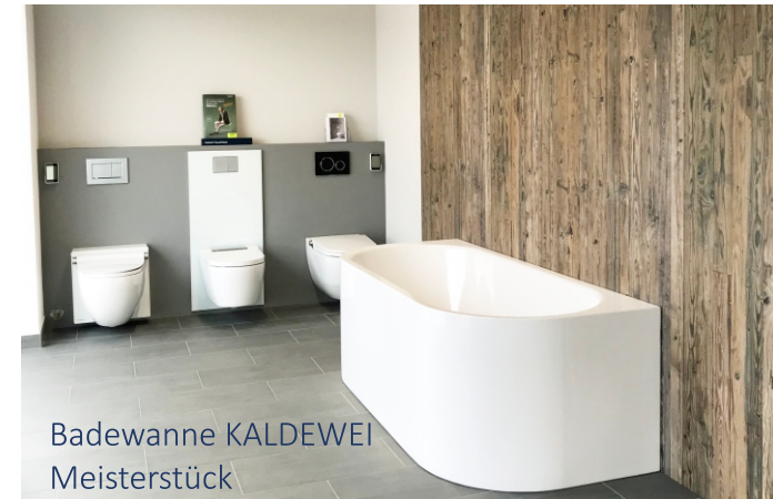
Badewanne KALDEWEI Meisterstück

Aufgrund der vom Bundesrat verordneten Massnahmen zur Eindämmung der Verbreitung des Corona-Virus musste unsere Ausstellung und der Laden vorübergehend geschlossen werden.