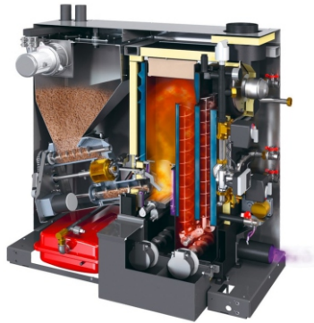
M-03 Automatische Holzfeuerung (Pellet)

Seit dem 1. Januar 2020 ist das neue Energieförderprogramm des Kantons Solothurn in Kraft. Wir haben für Sie einige spezifische Förderbedingungen aufgeführt: