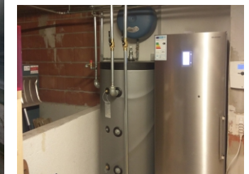
High-Tech im Hintergrund